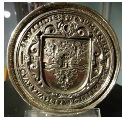
Grootzegel van de stad Arnhem, collectie museum Arnhem

Kortom, veel vrijwilligers waren en zijn druk in ons museum. Nieuwe zaken worden opgepakt en diverse werkgroepjes zijn doende om u in het nieuwe jaar iets moois te laten zien. Met z'n allen werken we daaraan. We drukken ons stempel erop.