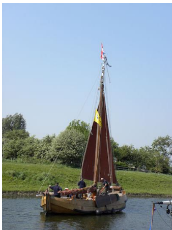
Afvaart naar Vlissingen

De Stichting Behoud Hoogaars bezet een aantal ruimtes als onze gasten. We hebben hen verzocht ons pand te verlaten. Met die ruimtes en met een herschikking van ruimte moeten de problemen opgelost kunnen worden.